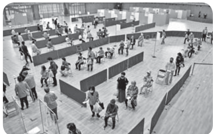
さわやかアリーナの集団接種

答 企業や大学などの情報共有に努め、市が実地している集団接種におけるワクチンの取り扱いや、運営方法など、情報提供を行っていききたい。