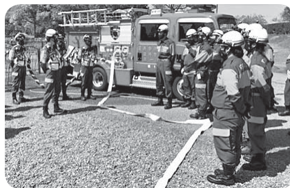
消防団の新入団員講習会

答 団員やその家族が、物品購入時の割引や各種サービスが受けられる「袋井市消防団応援事業」制度を、本年1月から運用開始した。また、訓練日数の削減や訓練礼式及び操法査閲大会の廃止など、現役団員が活動しやすく新入団員が入団しやすい環境の整備を行っている。